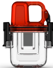
INREACH MINI UNTERWASSERGEHÄUSE

Art.Nr.: 010-01879-00 EAN: 0753759186265 UVP: 399,99 €