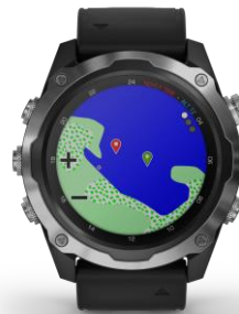
Eintauch- und Auftauchpunkte