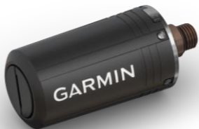
DESCENT T1 TANKPOD Schwarz

Art.Nr.: 010-12811-00 EAN: 0753759223571 UVP: 399,99 €